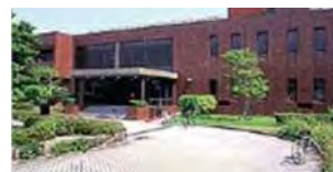
山口大学 大学会館